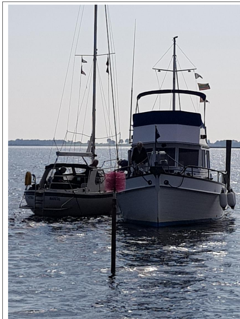
Dommerbåd og slæbebåd i havnehullet på Birkholm