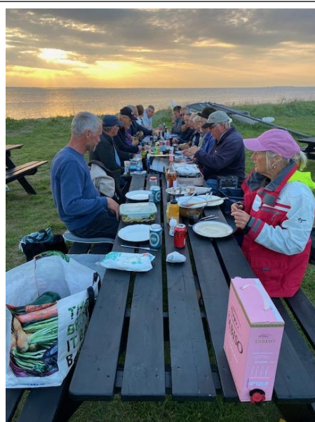
Spisning i solnedgangen