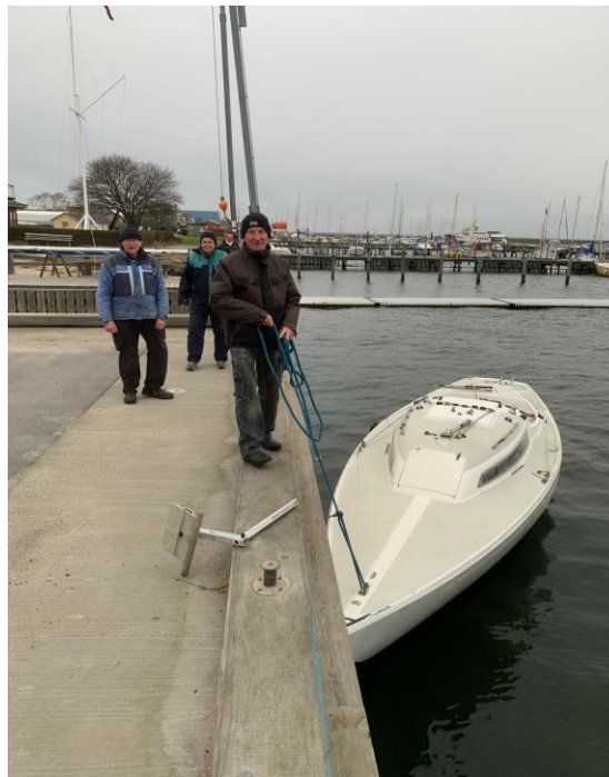
Ungdomsafdelingen tager H-båden op

Festudvalget mangler medlemmer, så meld dig til formanden, hvis du har lyst