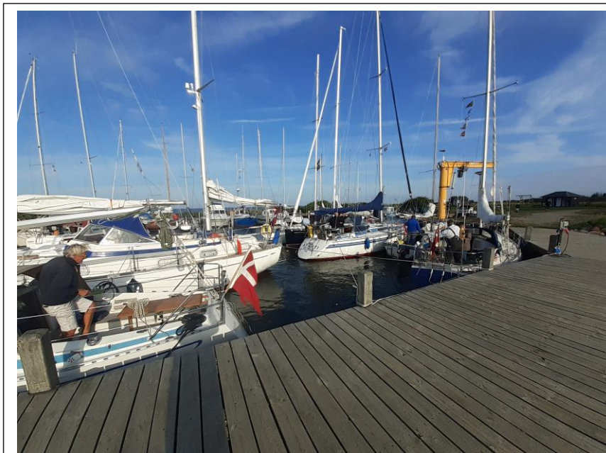
En propfyldt Birkholm Havn, hvor alle pladserne var reserveret forud.